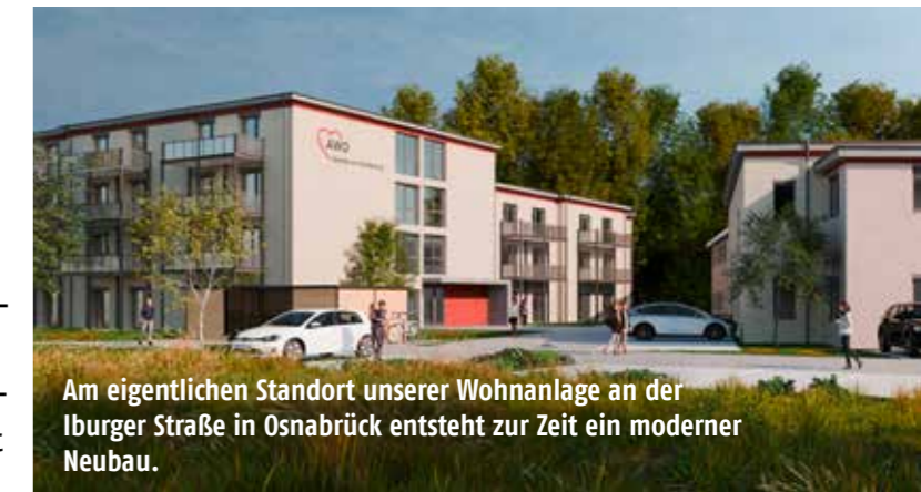
Am eigentlichen Standort unserer Wohnanlage an der Iburger Straße in Osnabrück entsteht zur Zeit ein moderner Neubau.

brück. Einkaufsmöglichkeiten, Restaurants, Ärzte, etc. sind mit dem Rad oder zu Fuß gut zu erreichen. In unmittelbarer Nähe gibt es Möglichkeiten für sportliche und andere Freizeitgestaltungen. Zur nächst größeren Stadt Osnabrück (ca. 10 km) besteht eine gute Verkehrsanbindung per Bus oder Bahn.